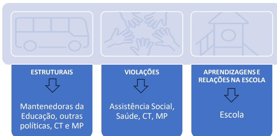
Figura 1 – Motivos da exclusão escolar e correlações com órgão do SGDCA