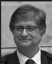
Paulo Gustavo Gonet Branco